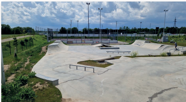
Skate/Bike-Park und Funcourt

Der neu errichtete Skate/Bike-Park und Funcourt in der Badgasse wird seit der ersten Stunde von vielen Jugendlichen für sportliche Aktivitäten und als Treffpunkt wahrgenommen und stellt eine große Bereicherung für junge Menschen in unserer Gemeinde dar.