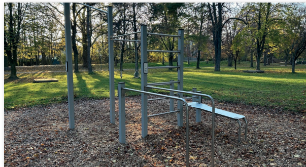
Calisthenics-Anlage im Park

Der neu errichtete Skate/Bike-Park und Funcourt in der Badgasse wird seit der ersten Stunde von vielen Jugendlichen für sportliche Aktivitäten und als Treffpunkt wahrgenommen und stellt eine große Bereicherung für junge Menschen in unserer Gemeinde dar.